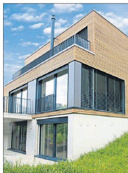
CASA-VITA® überzeugt mit professioneller Planung und Ausführung im Holzbau.

An herrlicher Hanglage in Uznach baute CASA-VITA®/Frefel Holzbau AG im Kundenauftrag ein 6½-Zimmer-Haus. Dieses wird «Am Abend der offenen Tür» vom Donnerstag, 13. August, der interessierten Öffentlichkeit zugänglich gemacht.