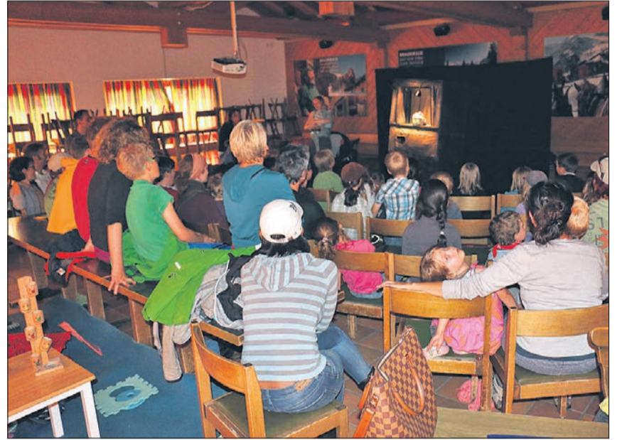
Die Kinder waren vom Figurentheater begeistert.

Am Mittwoch, 29. Juli, fand in der «Chämistube» in Braunwald der 3. Kindernachmittag statt. Nach Tischminigolf und Tierlibacken war das Figurentheater von Margrit Gysin auf Besuch. Eine grosse Anzahl Kinder wartete schon um 13.00 Uhr gespannt auf die Vorführung.